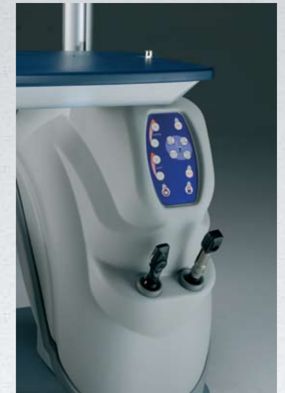
Pannello comandi digitale e supporto strumenti a mano Digital control panel and hand instruments support