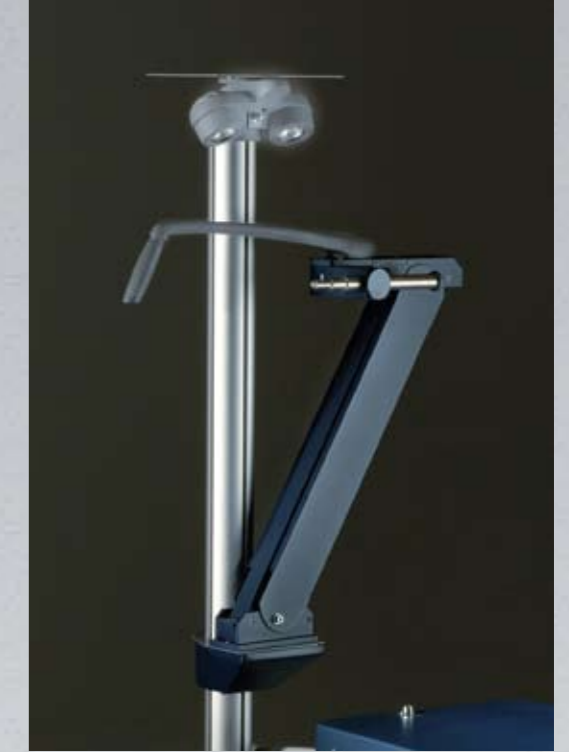
Modulo per forottero con movimento manuale [optional] Manual phoropter arm module [optional]