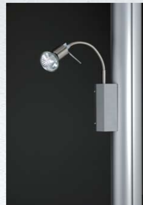
Spot aggiuntivo da colonna [optional] Extra spot light [optional]