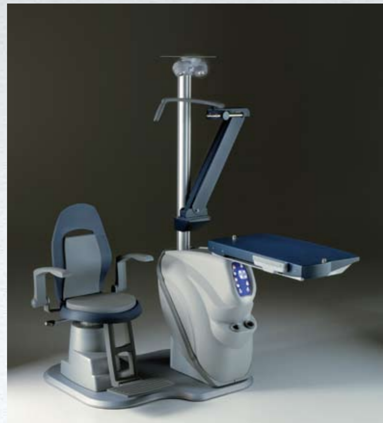
Riunito con piano traslabile per 2 strumenti con sistema di bloccaggio in ogni posizione Unit with sliding instruments table with lock system in all positions