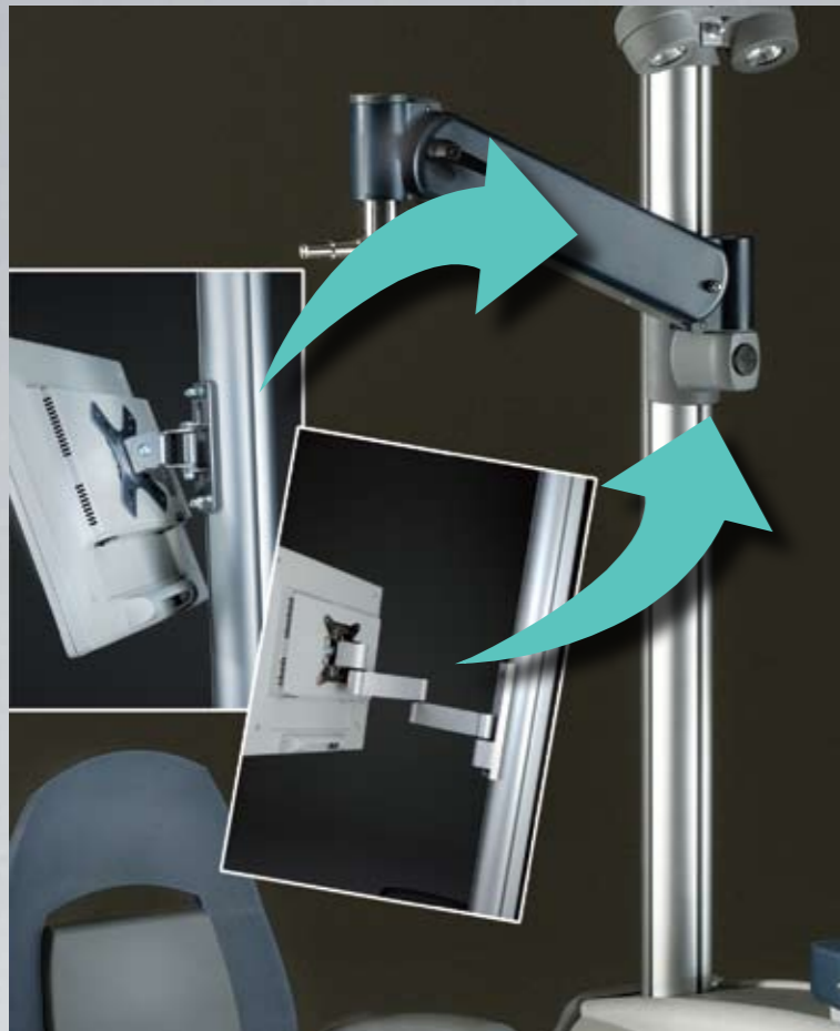
Supporto fisso e supporto snodato porta monitor [optional] Fix and movable monitor supports [optional]