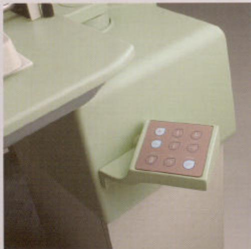
Pannello comandi digitale Digital control panel